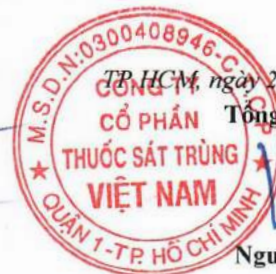
Thái Nguyên Luật